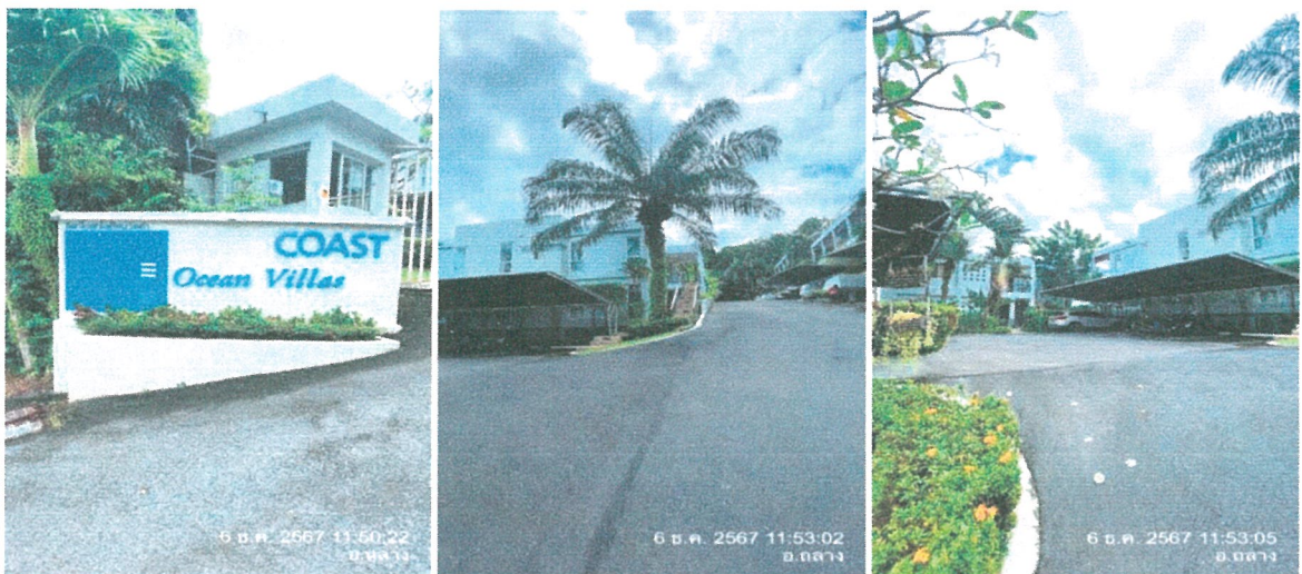
รูปภาพที่ 1.2 การใช้ประโยชน์พื้นที่อาคาร

ปริมาณการจราจรเพิ่มขึ้นจากก่อนมีโครงการเพียงเล็กน้อย โดยสภาพการจราจรเมื่อเทียบกับค่ามาตรฐานสำหรับจำแนกสภาพการจราจรยังจัดอยู่ในกลุ่มเดียวกับก่อนมีโครงการ โดยสภาพการจราจรยังคงคล่องตัว ปริมาณการจราจรถนนบ้านอ่าวปอ-บ้านแหลมหลง ยังคงเบาบาง ดังนั้นผลกระทบที่เกิดขึ้นต่อการคมนาคมจึงอยู่ในระดับต่ำ เพื่อลดผลกระทบให้เกิดน้อยที่สุด โครงการจะติดตั้งเครื่องหมายจราจรบริเวณทางเข้าออกและบริเวณที่จอดรถภายในโครงการ รวมทั้งจัดให้มีเจ้าหน้าที่อำนวยความสะดวกในการเข้า-ออกพื้นที่โครงการและบริเวณลานจอดรถ