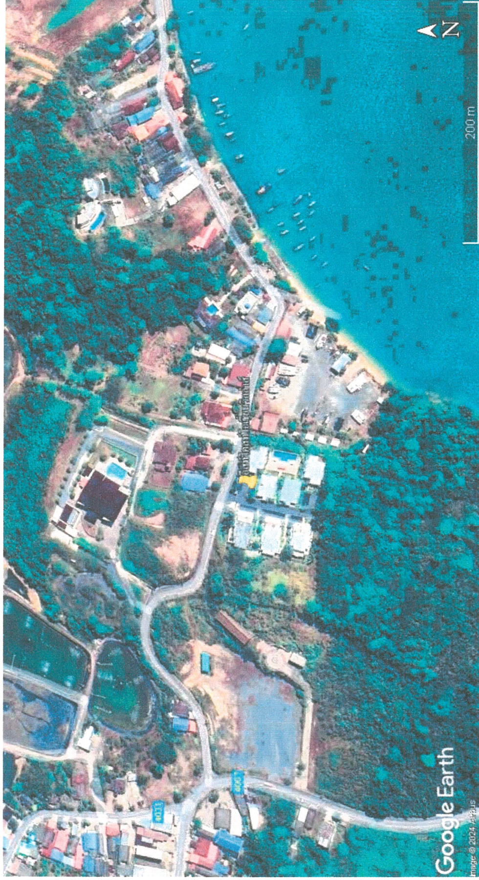
รูปภาพที่ 1.1 แผนที่ตั้งโครงการ ইসท์ โคสต์ โอเชียน วิลล่าส์